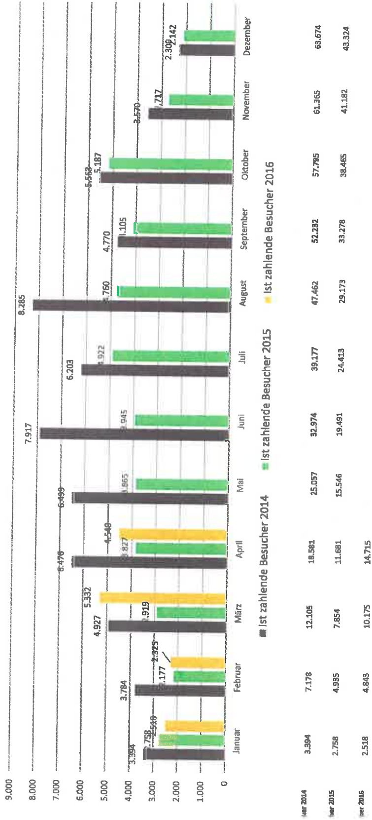
Vergleich zahlende Besucher 2014 - 2016

Der Rückgang der Besucher des Jahres 2015 konnte gestoppt werden. Seit Anfang September 2015 zeigen die diversen Maßnahmen für die Zielgruppe der Familien (Sommercamp, Indoor Abenteuerplatz und LEGO-Zeitreise) positive Auswirkungen. Ab den Monaten Februar und März 2016 steigen die Besucherzahlen stetig an (Januar bis April plus 26% zum Vorjahr!). Vor allem an den Wochenenden ist das Haus sehr gut besucht.